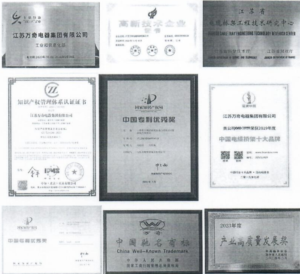
图 1 荣誉资质

企业先后获高新技术企业、专精特新“小巨人”、省工程技术研究中心、省质量信用产品证书、省质量诚信企业、省民营科技企业等荣誉称号。由本集团公司负责编制并修订的国家标准 GB/T23639-2017《节能耐腐蚀钢制电缆桥架》提升了产品的技术要求和质量标准，推动了电缆桥架的行业由粗放型向低碳集约型经济的转变，加快了淘汰落后产能，促进了行业产品升级换代，为广大用户选择高耐腐蚀节能产品提供了有力的技术支持。