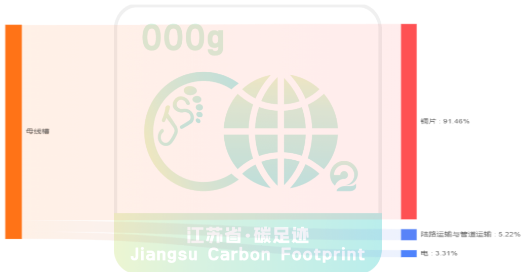
附图 5.1-3 各生命周期阶段碳排放桑基图